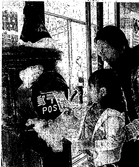
西宮にサンタクロースを呼ぼうと、はがきを出す親子（西宮市池田町のフレンテ西宮で）